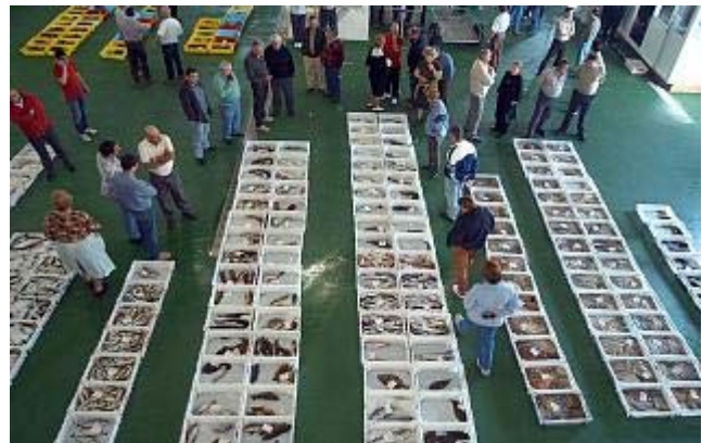
Venta de productos del mar en un mercado gallego.

"La crisis se nota", reconocen los vendedores, "pero la Navidad se respeta en todas partes, y aunque se ahorre en otras cosas, la gente quiere tener buenas viandas en la mesa", argumentan.