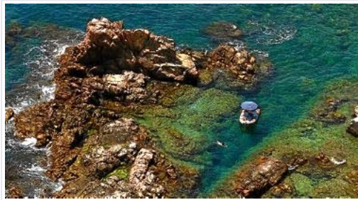
Una persona bucea en aguas de las islas Formigues el verano pasado.