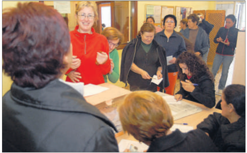
Las elecciones en la agrupación de marisqueo a pie de Vilanova se celebraron sin incidentes. // Iñaki Abella

El coste de la actuación asciende a más de 200.000 euros, que son sufragados por la Diputación Provincial y la propia cofradía vilanovesa.