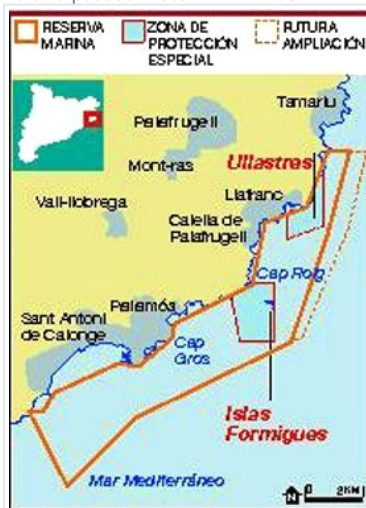
Si desea ver el gráfico en PDF haga click en la imagen.